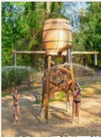
EL DORADO WASSERSPIELPLATZ

Den El Dorado-Wasserspielplatz erkunden, Klettern im Niederseilgarten , Goldwaschen am Wasserfall, eine Runde mit der Westerneisenbahn drehen oder auf den Spielplätzen toben – in der Westernstadt wird den Kids nicht langweilig!