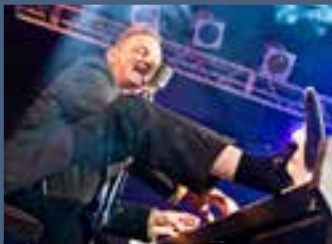
27.12. ROCKABILLY NIGHT