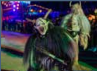
26.12. GROBER PERCHTENLAUF