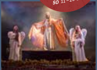
CHRISTMAS MEMORY SHOW U.V.M.!

Preise, Programm und Infos unter www.pullmancity.de